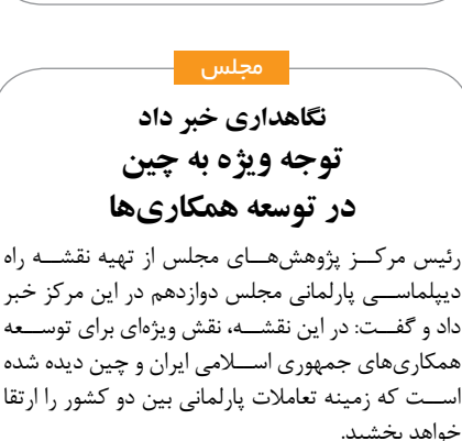
رئیس مرکز پژوهش‌های مجلس از تهیه نقشه راه

فعال اصلاح با انتشار یادداشتی، به رفع حصر مهدی کروی واکنش نشان داد. به گزارش خبرنگاران، احمد زیدآبادی، فعال سیاسی اصلاح طلب و روزنامه نگار، در کانال تلگرامی خود نوشت: در میان اوضاع آشفته منطقه و تنگی بی‌سابقه وضعیت معیشت مردم، خبر رفع حصر شیخ مهدی کروی، اتفاق مبارک و خوشایندی است که امید است با رفع حصر از میرحسین و خانم رهنسورد و آزادی یکایک زندانیان سیاسی و عقیدتی، دایره رهایی کشورمان از پدیده شوم حصر و زندان سیاسی تکمیل و راه تازه‌ای پیش روی ایران گشوده شود.