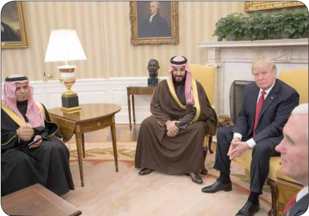
دونالد ترامپ در جریان دیدار با محمد بن زاید

یک روزنامه آمریکایی با اشاره به اینکه «رئیس‌جمهور منتخب آمریکا با یک واگرایی جدید با متحدان قدیمی خود در خاورمیانه مواجه است» نوشت: «کشورهای حاشیه خلیج فارس اکنون خواستار موضع سخت‌تر در قبال اسرائیل و نرشم در قبال ایران هستند؛ موضعی که بسا دوره اول رئیس‌جمهور منتخب تفاوت زیادی دارد.