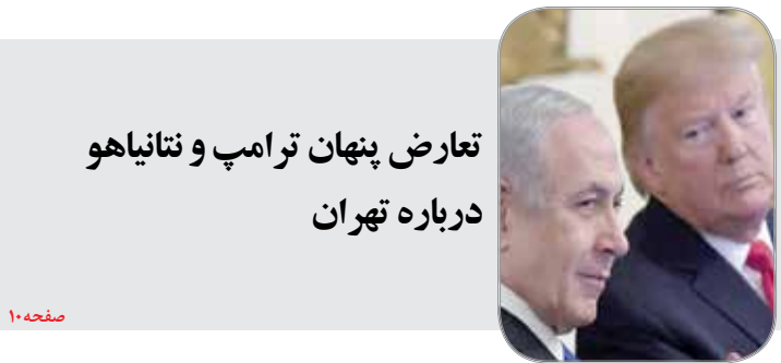
تعارض پنهان ترامپ و نتانیاهو درباره تهران