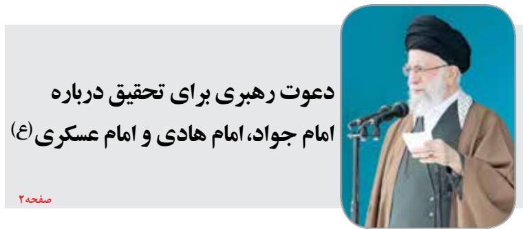
دعوت رهبری برای تحقیق درباره امام جواد، امام هادی و امام عسکری (ع)