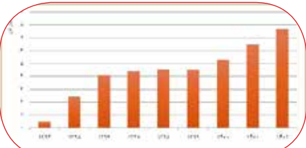
نمودار ۲، آمار تولید خطوط کسناستره در شرکت معدنی و صنعتی گهرزمین

در سال ۱۴۰۲ افزایش یافته است. عملکرد تولید کسناستره گهرزمین در سال گذشته نه تنها از رشد بیش از ۱۸ درصدی آن در مقایسه با سال ۱۴۰۱ حکایت دارد بلکه به میزان ۲۷ درصد نیز از ظرفیت