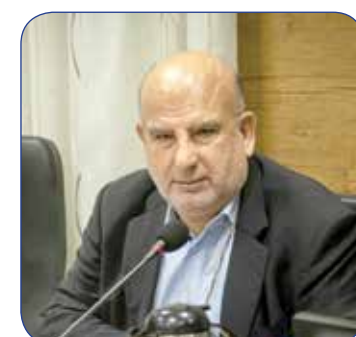
دکتر عبدالعلی ناصری، مدیرعامل شرکت توسعه نیشکری و صنایع جانبی

در خدمت کوتاهی نمی کنم، خدایا تو شاهی - این زمزمه می همیشگی عالمی وارسته و مجاهدی خستگی ناپذیر بود که در میدان سازندگی برای ایرانی آباد و سربلند، می وقفه همت گماشت و بسرانجام حین خدمت در راه اعتلای وطن، در سانحه دلخراش سقوط بالگرد، به همراه تنی چند از یاران صدیقش، به شهادت رسید. او که یار دلسوز رهبری و خادم مخلص مردم بود، چه در مسند عدلیه و چه در کسوت ریاست جمهوری، هر کجا مسئولیتی برعهده داشت، با گام نهادن در میان مردم و حضوری صمیمانه، آرامش و امید را به ارمغان می آورد. کارگران نیشکری هفت تپه، هیچگاه یاد و خاطره سید محرومان را از یاد نخواهند برد، او با درایت و دلسوزی، امیدی دوباره در دل کارگران دمید و در راه احقاق حقوق آنان، گام های بلندی برداشت؛ گام هایی که ثمره اش آبادانی و سرزندگی و تولید بود. اردیبهشت ماه سال گذشته بود که در سفر به خوزستان، نیشکری ها با شادمانی به استقبالش شتافتند. گویی همین دیروز بود که قطارش در میان کارگران نیشکری ایستاد و همدل مردمانی شد که به پیشوازش آمده بودند. اما امروز، با خبر شهادتش در سننجر خدمت، دلی پر حسرت و درغ برای جامعه کارگری ایران مانده است. امروز، یک ملت در سوگ خادم صدیق و دلسوز خود نشست است. آیت الله سید ابراهیم رئیسی، به حق سیدالشهدای خدمت است؛ کسی