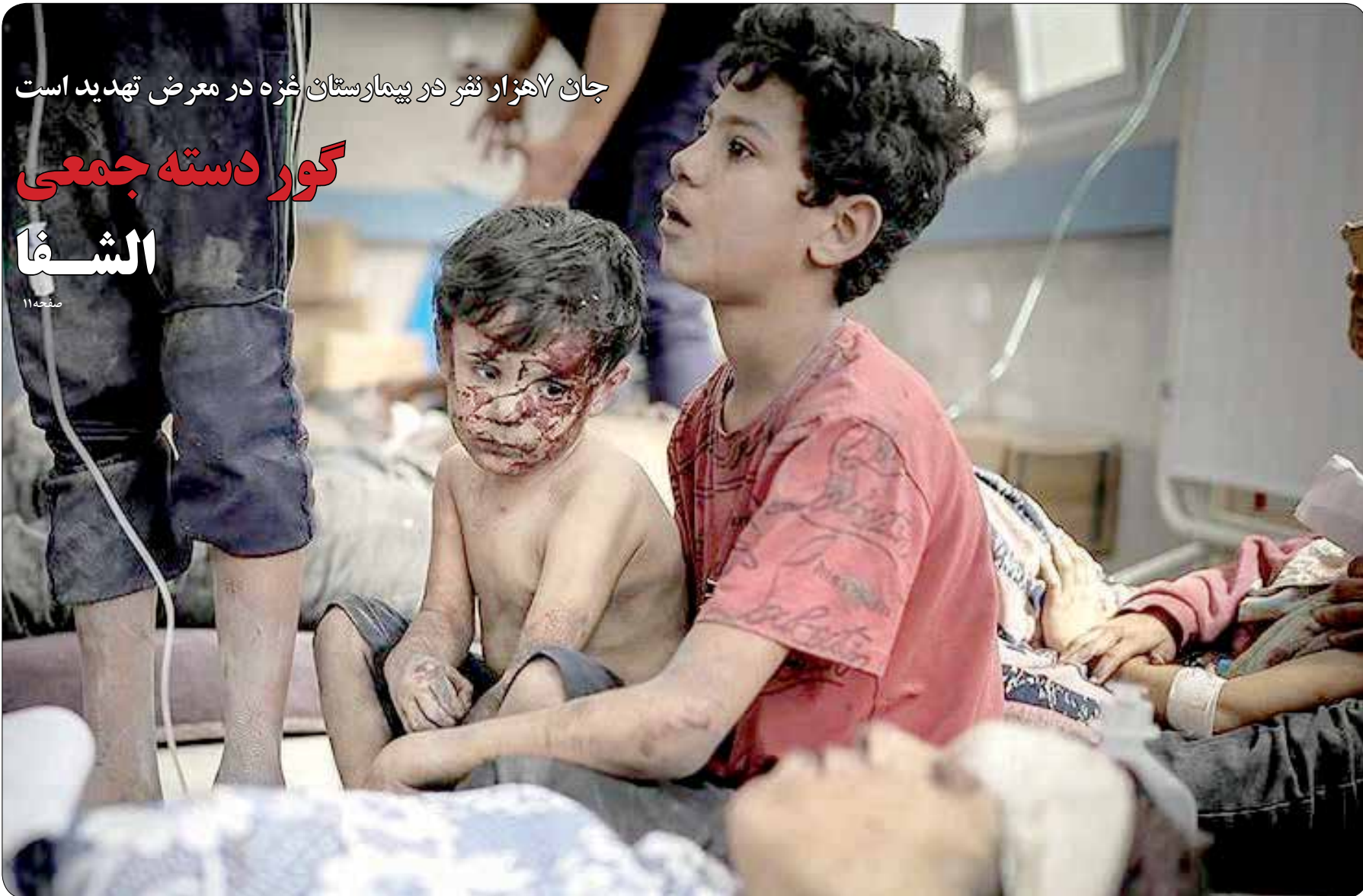
جان‌آهزار فقر در بیمارستان غزه در معرض تهدید است