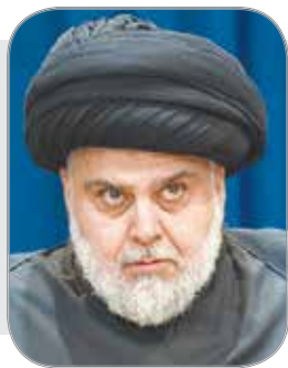
فرمان تحریم انتخابات عراق توسط مقتدی صدر