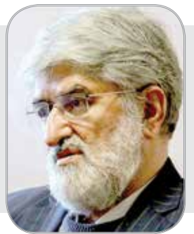
سطل آشفالی آتش نزدّم!