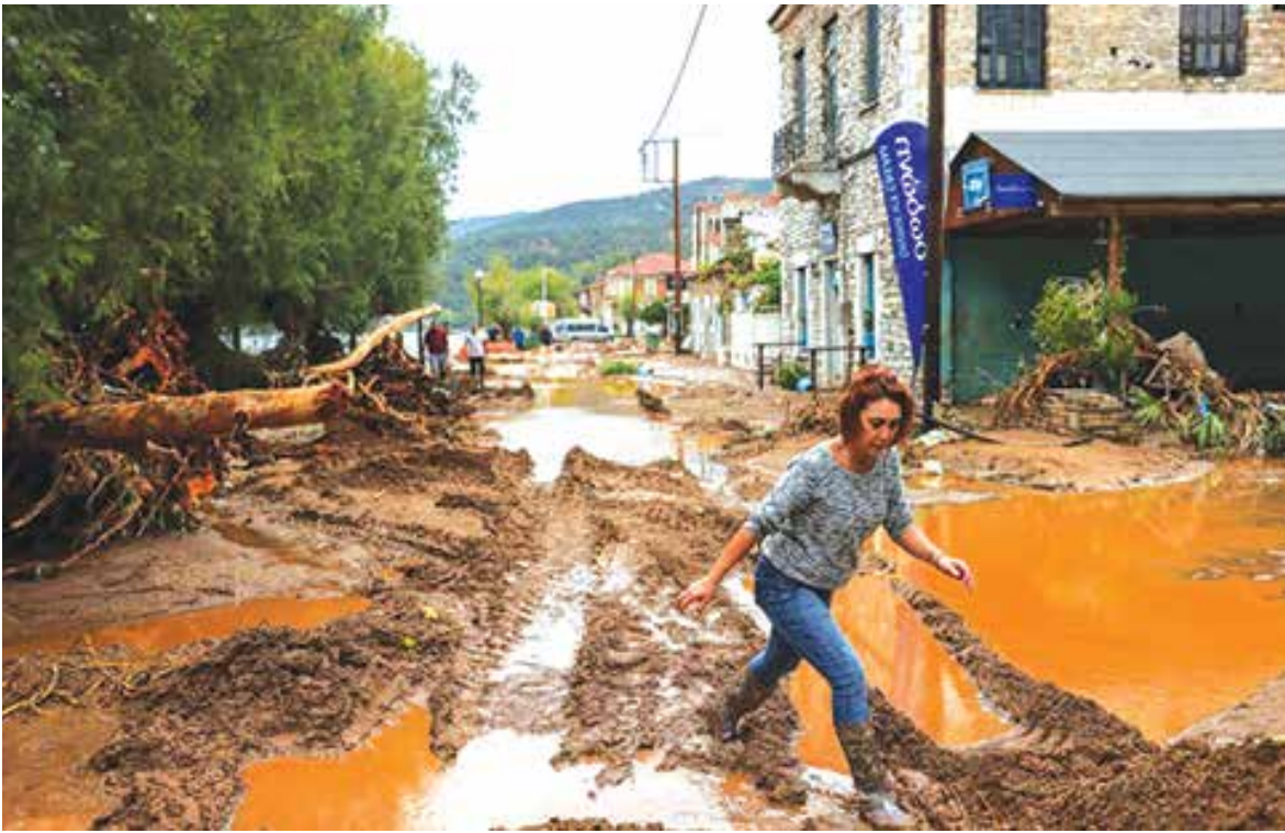
سیل در یونان