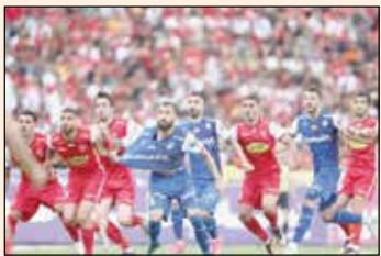
قواینسن مورد تاکیید

فدراسیون جهانی فوتبال، به کارگیری سیستم کمک داور ویدئویی (VAR) در دربی پایتخت را با دو مانع بزرگ مواجه کرده است. به گزارش مهر، فدراسیون فوتبال ایران با توجه به اجبار کنفدراسیون