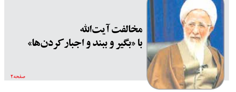
مخالفت آیت الله با «بگیر و ببند و اجبار کردن‌ها»