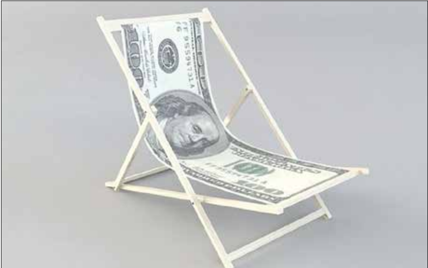
پاسخ، بی‌نتیجه ماند.

مدیرکل دارو و مواد تحت کنترل سازمان غذا و دارو، ادامه داد: مصوبه ابلاغی ستاد تنظیم بازار از سال قبل بر ممنوعیت عرضه دارو در پلتفرم‌های دیجیتال بدون اخذ مجوزات لازم از وزارت بهداشت تأکید داشته و با توجه به