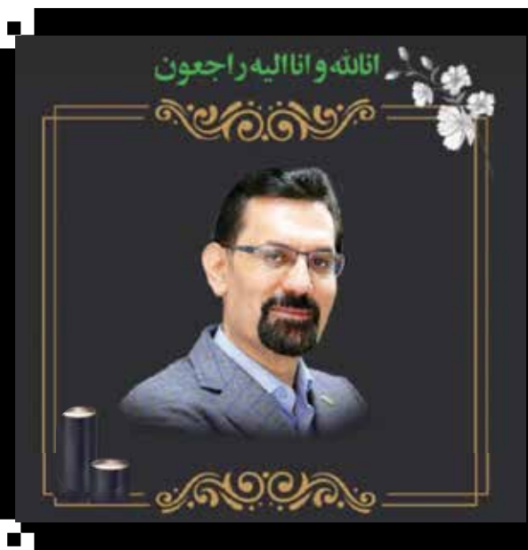
اللهم وانا الیه راجعون

به گزارش مردم‌سالاری آنلاین، متن پیام به شرح ذیل می‌باشد: کل من علیها فسان و یبقی وجه ربه ذوالجلال والاکرام. مرگ عزیزانی همچون دکتر اصغر نعمتی هر چند جانکاه است؛ اما یادآور آن است که اگر صفاتی همچون مردمی بودن و مردمی زیستن، فروتنی و تواضع، صداقت و اخلاص، همت و پشتکار و ارائه خدمت به همکاران و اعضای انجمن مدیران روزنامه‌های غیردولتی و... در وجودت باشد همواره در یاد و خاطره دوستان باقی خواهد ماند. آری یاد عزیزانی همچون دکتر نعمتی در میان همکاران و روزنامه‌نگاران هرگز فراموش نخواهد شد.