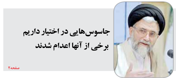
جاسوس‌هایی در اختیار داریم برخی از آنها اعدام شدند