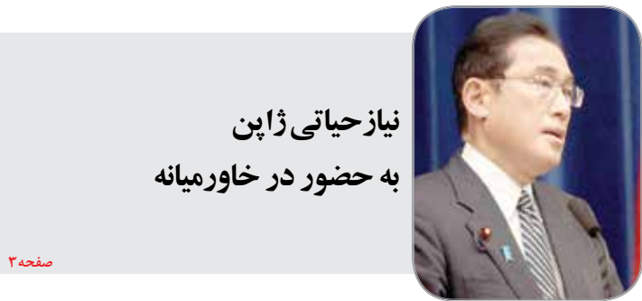
نیاز حیاتی ژاپن به حضور در خاورمیانه