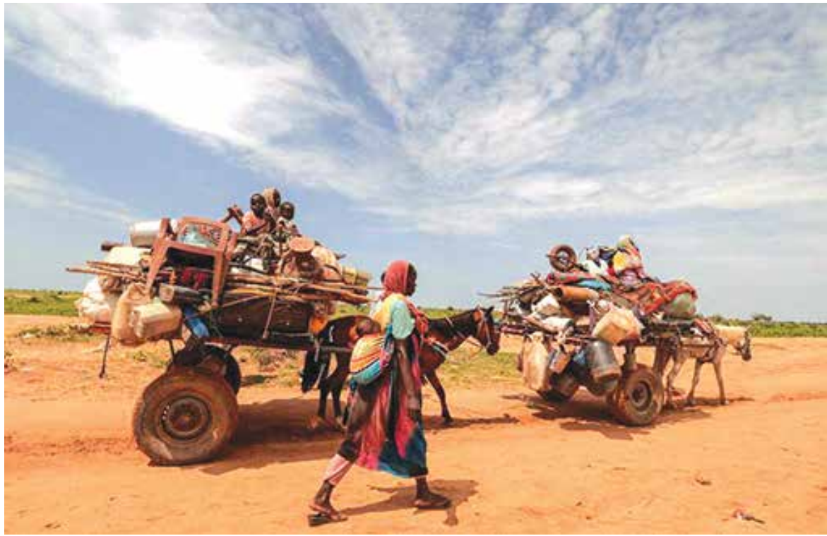
آوارگان جنگی دارفور سودان در کشور همسایه چاد