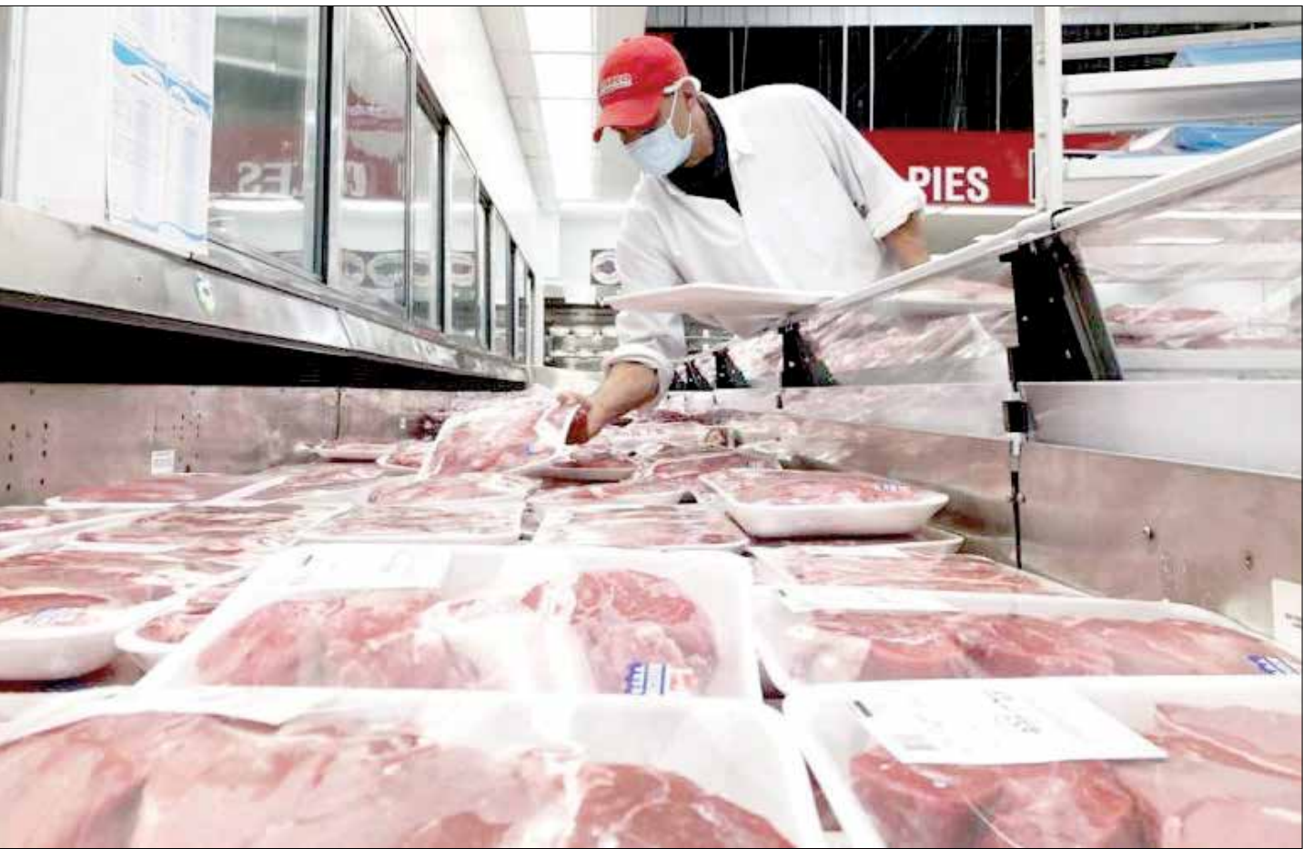
صادرات گوشت از یک شرکت صادراتی در پاکستان.