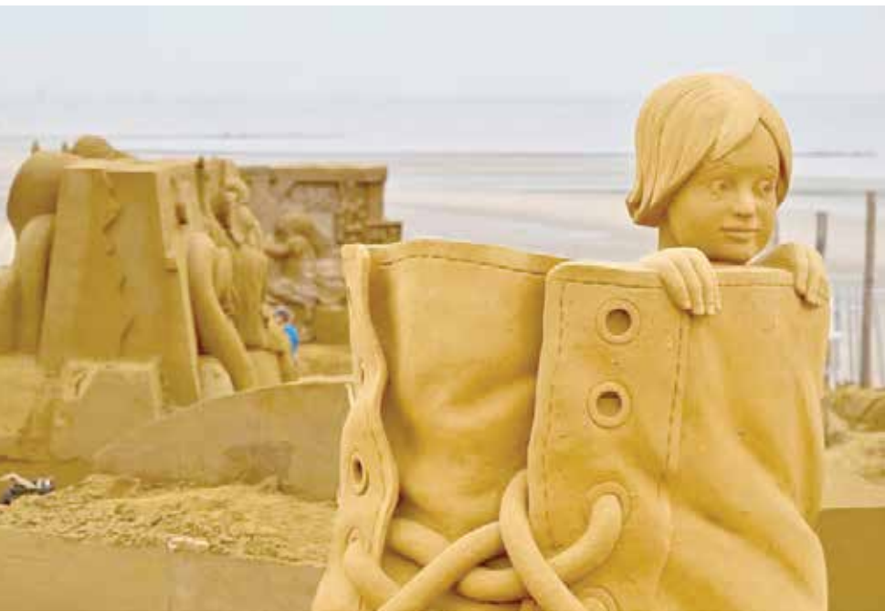
جشنواره سازه‌های شنی در بلژیک