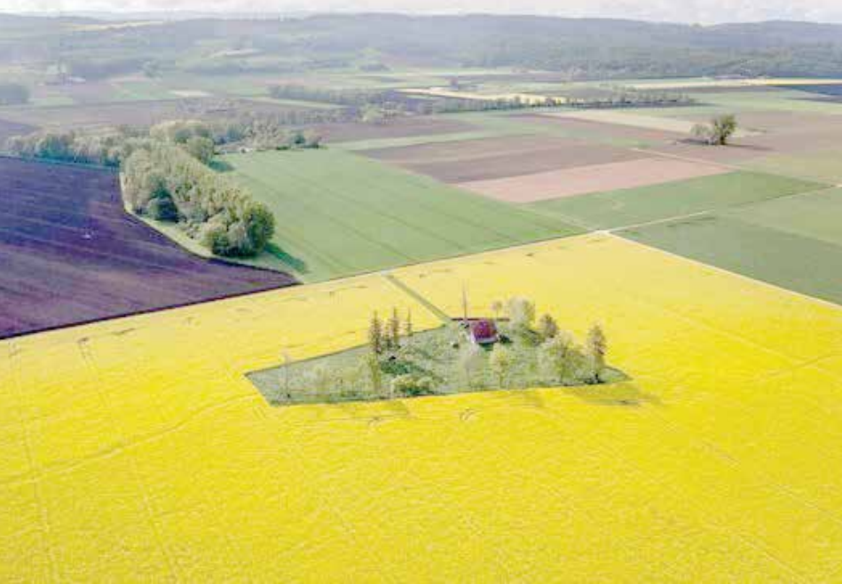
مزرعه کلزا در سوئیس