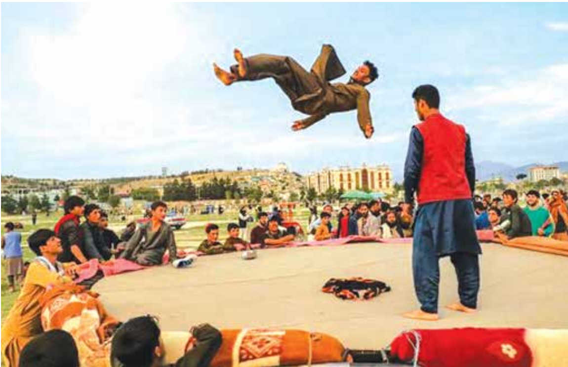
ترامبولین بازی جوانان افغانستانی در پارک «چمن حضوری» در شهر کابل