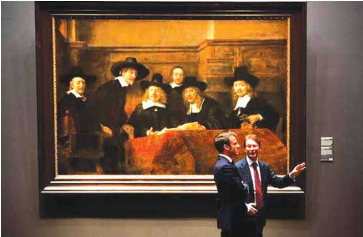
تصویر اماتونل مکرون، رئیس جمهور فرانسه و مدیر موزه ریکس در آمستردام هلند