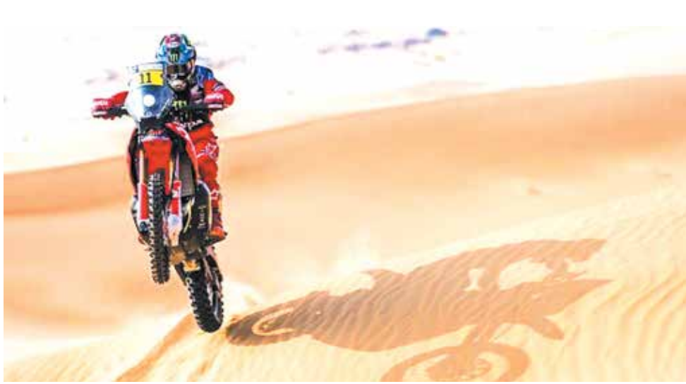
مسابقات موتورسواری در صحرا در ابوظبی امارات

شاید باور کردنی نباشد اما سیب زمینی می‌توان ریزش مو را درمان کند. این موضوع اخیرا بر اساس پژوهش‌های حوزه بهداشت سلامت پوست و مو بررسی شده و می‌تواند برای بسیاری از افراد که با مشکل ریزش مو رو به رو هستند مفید باشد. درمان ریزش مو موضوعی است که از سوی بسیاری از افراد مهم محسوب می‌شود، بنابراین برای درمان ریزش مو به سراغ بسیاری از شاموهای گرانقیمت یا محصولات می‌روند که پایه شیمیایی دارند. با این وجود گاهی استفاده از روش‌های طبیعی مزایایی به مراتب بیشتر از روش‌های مصنوعی دارند. برای مثال سیب زمینی یکی از مواردی است که می‌تواند به شما کمک کند. موهای خود را درمان کنید اما چگونه؟ برای این کار می‌توانید سیب زمینی را درون مخلوط کن ریخته و عصاره حاصل شده را روی موها به شکل ماسک قرار دهید، جالب است بدانید سیب زمینی پوستتان را هم شفاف و زیبا می‌کند. بنابراین می‌توانید از ماسک سیب زمینی و گلاب روی پوست خود نیز استفاده کنید. یک روش جالب دیگر برای رشد موها، ترکیب آب پیاز و سیب زمینی پوره با یکدیگر و ماسک کردن آن روی سر است. به طور کلی پیاز نیز به تنهایی می‌تواند به رشد موهای شما کمک کند. ترکیب سیب زمینی، تخم مرغ و عسل نیز برای موهای شما بسیار مفید است. کافیست یک تخم مرغ را با دو سیب زمینی پوره و یک قاشق عمل مخلوط کنید. ترکیب مناسب دیگر نیز یک قاشق روغن زیتون یا نارگیل با پوره دو سیب زمینی کوچک یا یک سیب زمینی بزرگ و یک عدد تخم مرغ است.