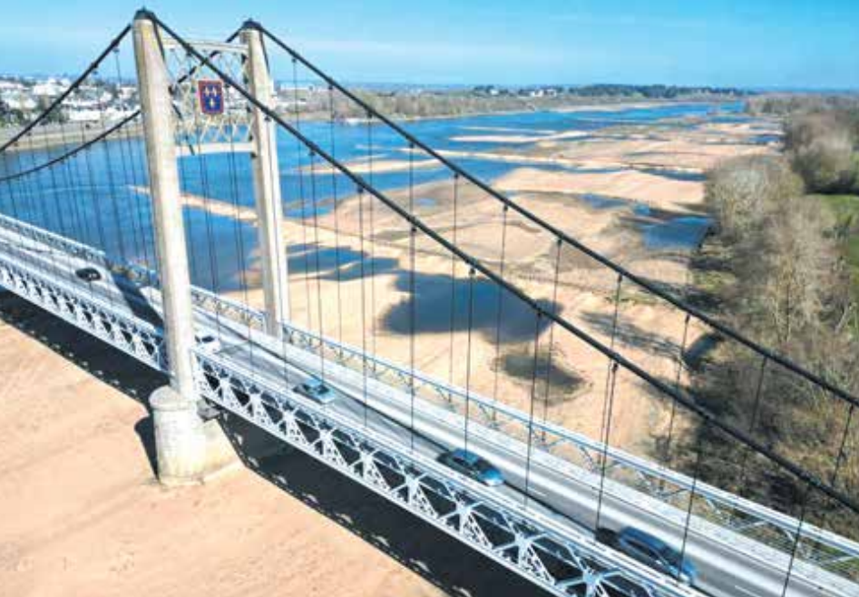
خشک شدن رودخانه‌های فرانسه در اثر خشکسالی