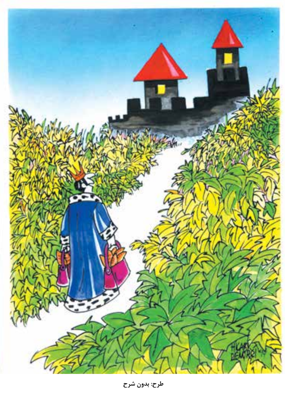
طرح: بدون شرح