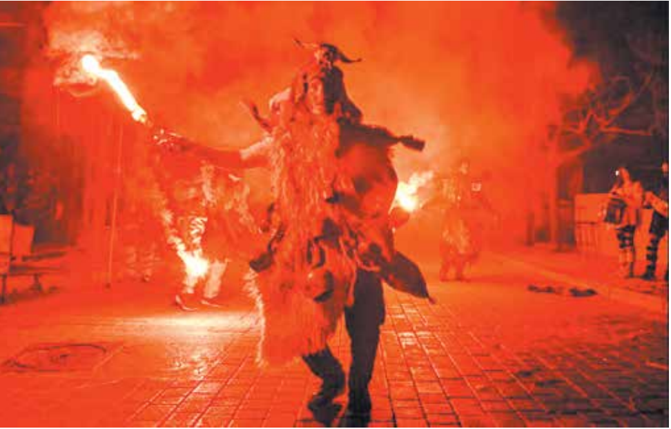
کارناوالی سنتی در شهر آفیسنا یونان