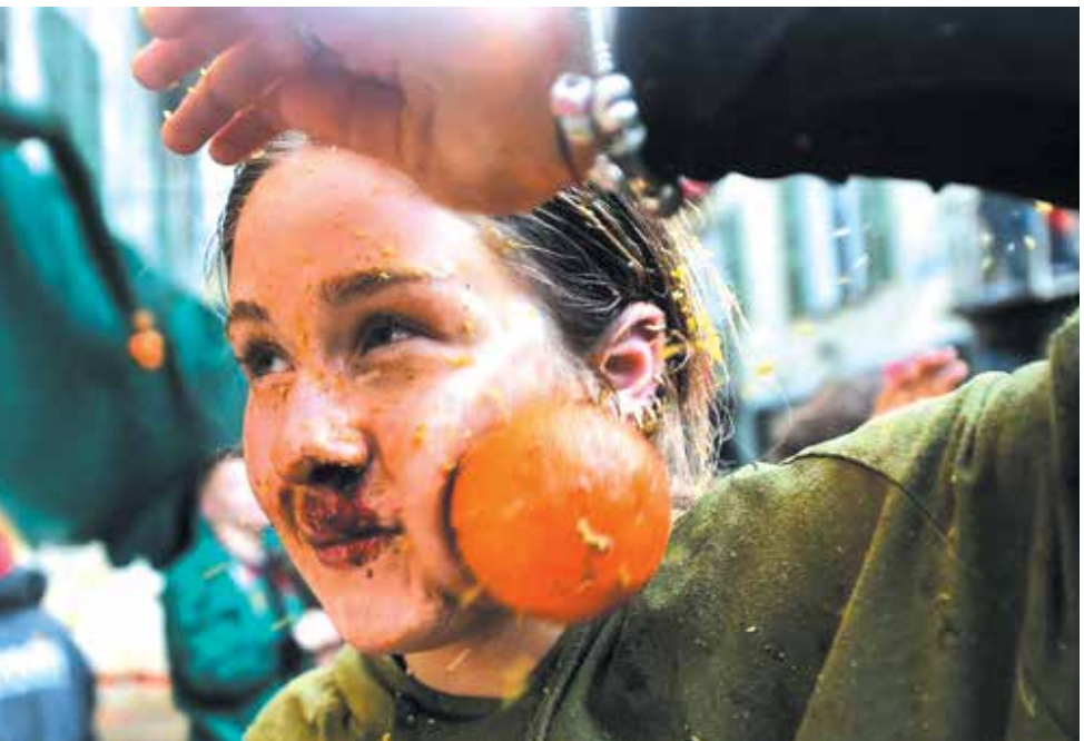
جشنواره جنگ برتقال در شمال ایتالیا