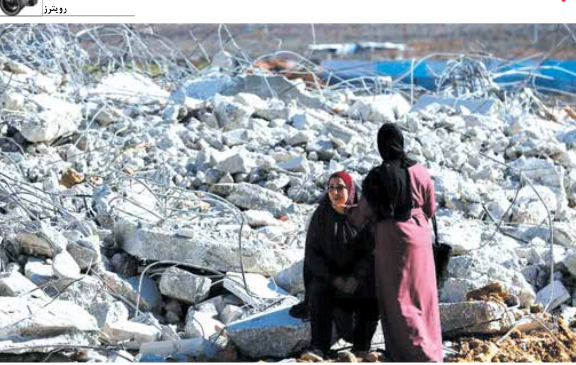
نیروهای اسرائیلی خانه یک فلسطینی در شهر الخلیل در کرانه باختری اشغالی فلسطین را تخریب کردند.