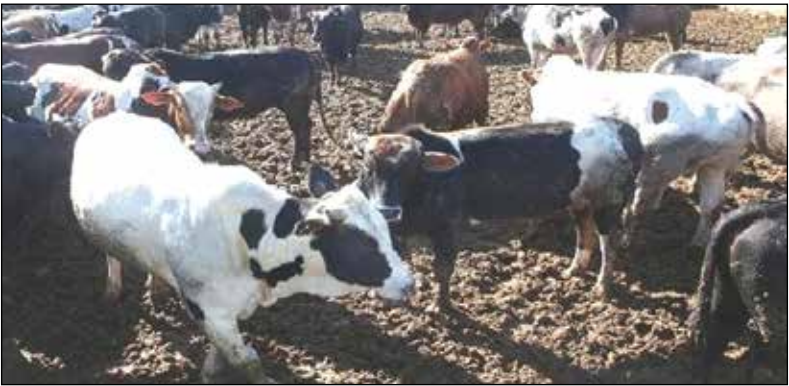
دامداری‌های همدان در حال فروش گوسفند و بزها برای تأمین نیازهای خود از دستفروشان محلی

این مشکلات به ۱۰ نفر رسیده است و ۲ هزار و ۳۰۰ نفر عضو و غیر عضو دانشیم که در حال حاضر به ۶۰ الی ۷۰ نفر رسیده است.فغانی در پایان این گفتگو، با بیان اینکه باید توزیع نهاده‌ها به درستی مدیریت شود؛ گفت: این نهاده‌ها در اختیار اتحادیه‌ها قرار گیرد تا در بین دامداران به صورت عادلانه توزیع شود.