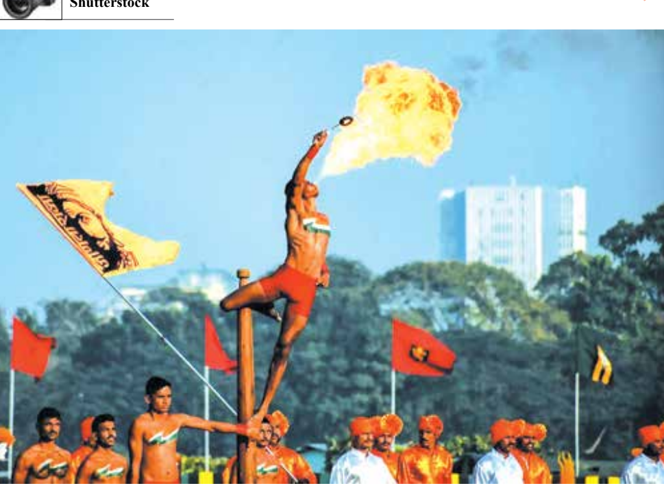
آتش بازی برخی از سربازان هندی برای جشن آتی ویجی دیواس در کلکته هند