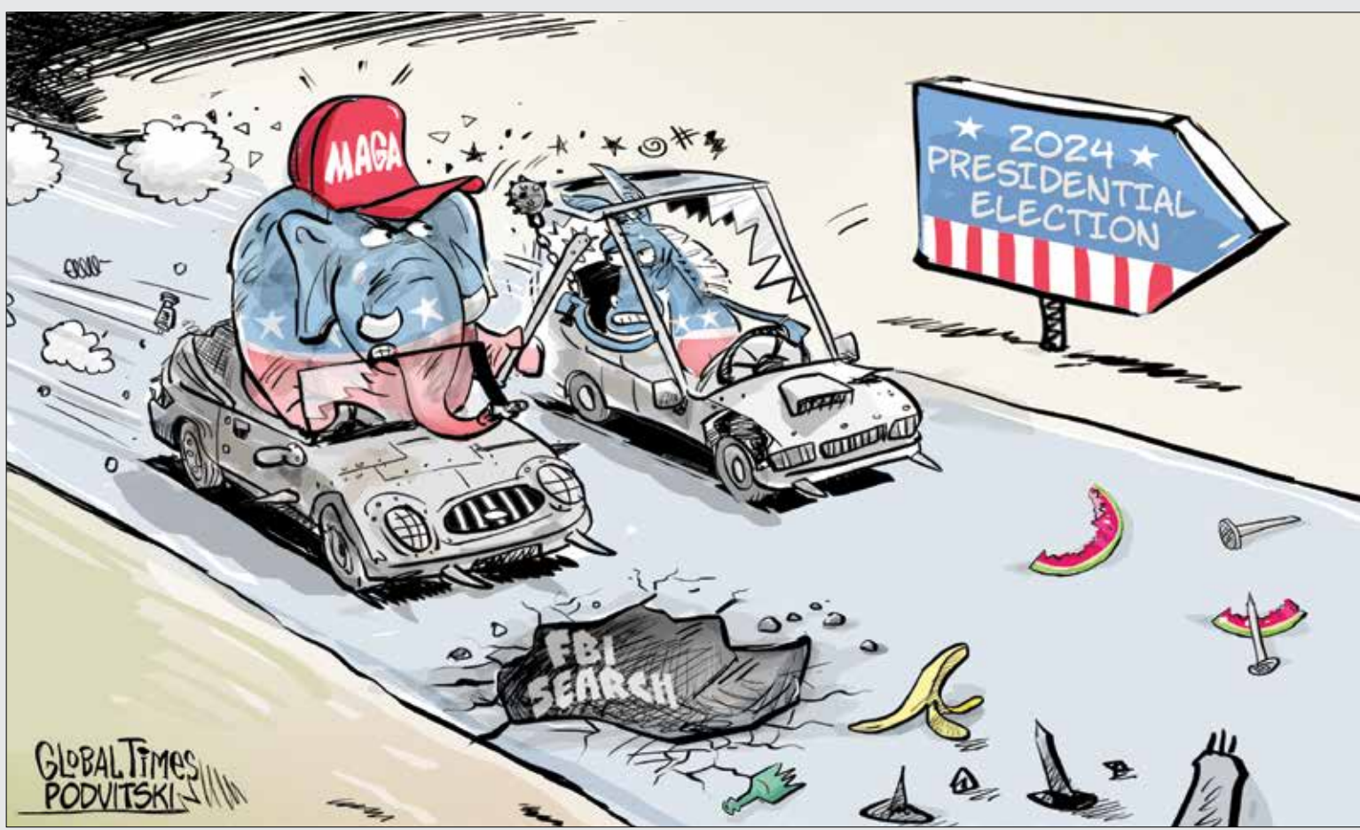
آمریکایی‌ها دنبال عبور از بایدن و ترامپ هستند