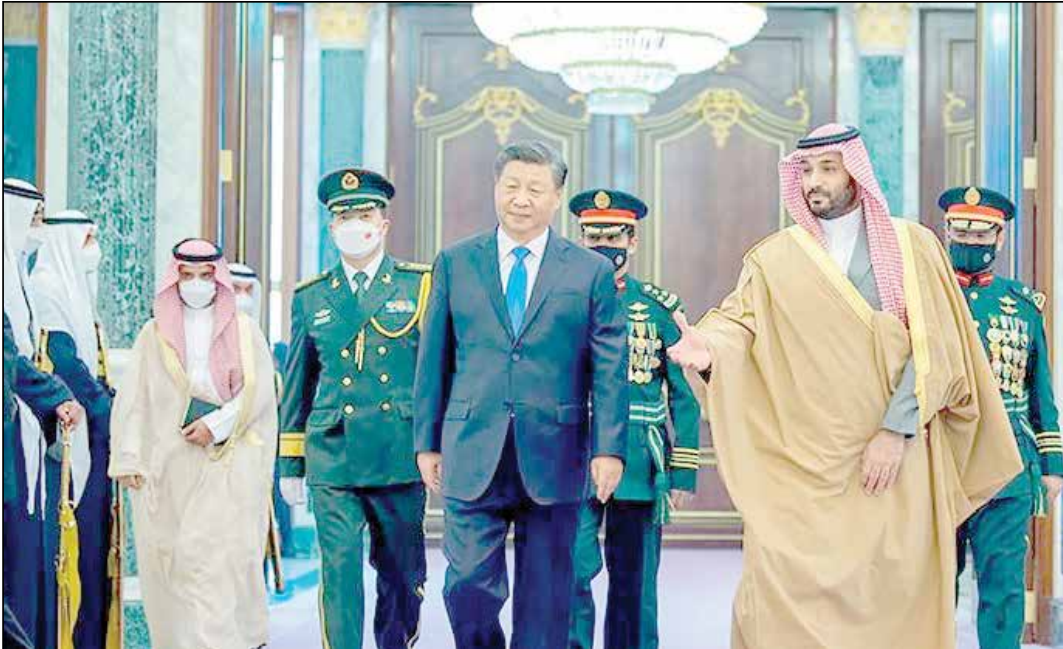
آغازگر دوران جدیدی از روابط با جهان عرب عرب کشورهای عضو شورای همکاری خلیج فارس و چین امروز در عربستان اعلام شد دو طرف به شمار می‌رود. در نشست مشترک سران

گروه سیاسی: رئیس‌جمهوری چین در میان تنش ملموس ریاض و واشنگتن به ریاض رفته‌است. «محمد بن سلمان» ولیعهد سعودی در دیدار «شی‌جین‌پینگ» رئیس‌جمهوری چین با بی‌اعتنایی به خواسته آمریکا تاکید کرد که «ریاض به شدت به اصل «چین واحد» متعهد و پایبند است.»