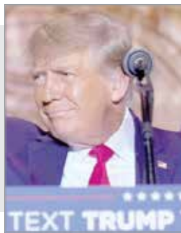
مرد دیوانه دوباره آمد