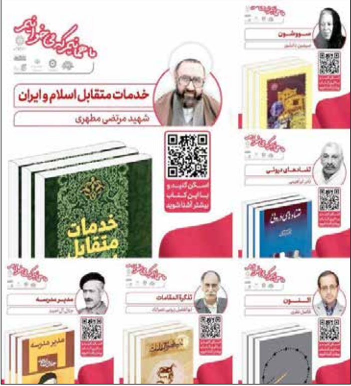
بیلبورد «لحظه صعد» در تهران