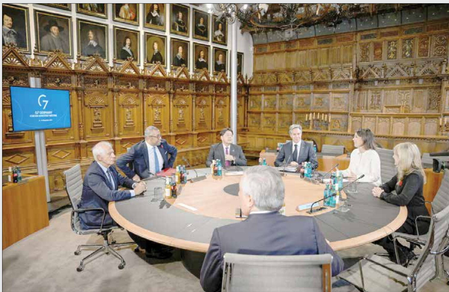
بیانیه وزرای امور خارجه گروه هفت