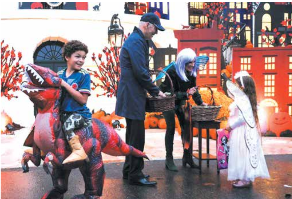
رئیس جمهوری و بانوی اول آمریکا در حال هدیه دادن به کودکان در جشن هالوین کاخ سفید