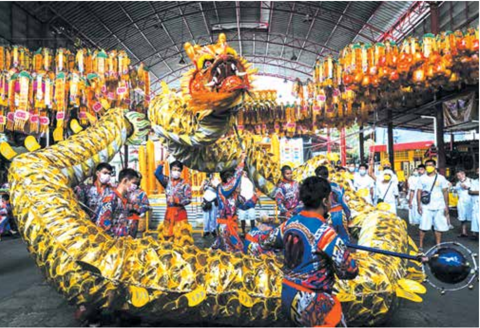
رقص ازدها در جشنواره گیاهخواری در معبد چینی جوسو کونگ در شهر بانکوک تایلند