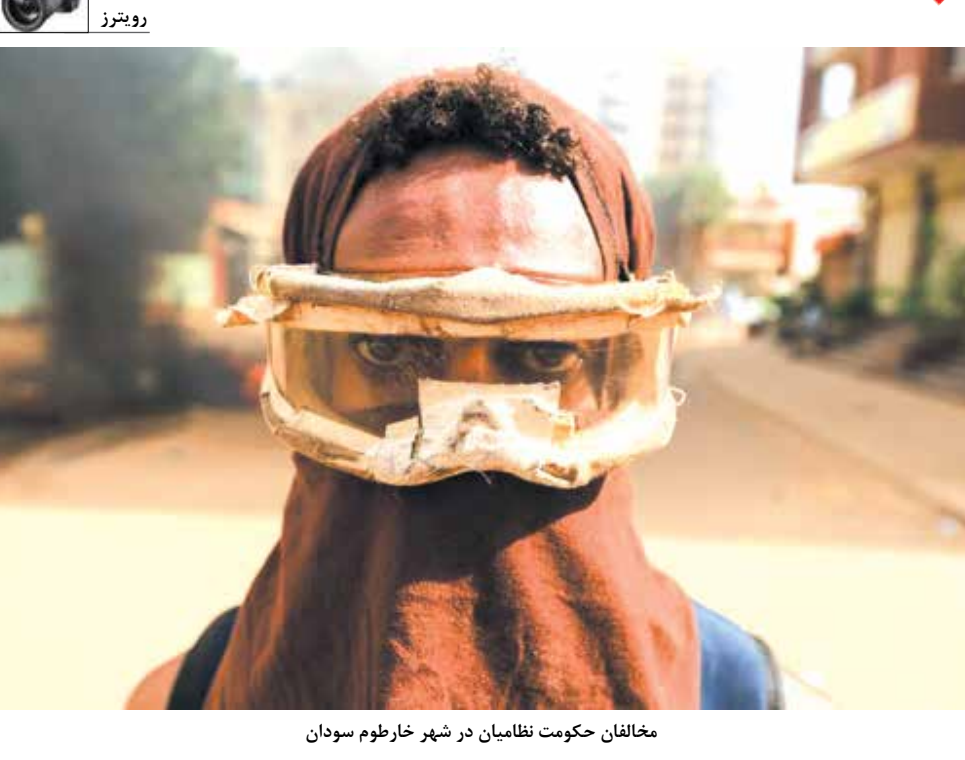
مخالفان حکومت نظامیان در شهر خارطوم سودان