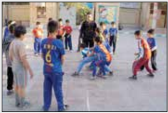
راه‌های درمانی و اصلاحی

برای رفع افتادگی شانه در کودکان و دانش‌آموزان وجود دارد که باید به آن توجه ویژه داشت. به گزارش ایسنا، به صورت طبیعی شانه‌ها باید با یکدیگر قرینه باشند و شانه در موازات تن قرار گیرد، گاهی