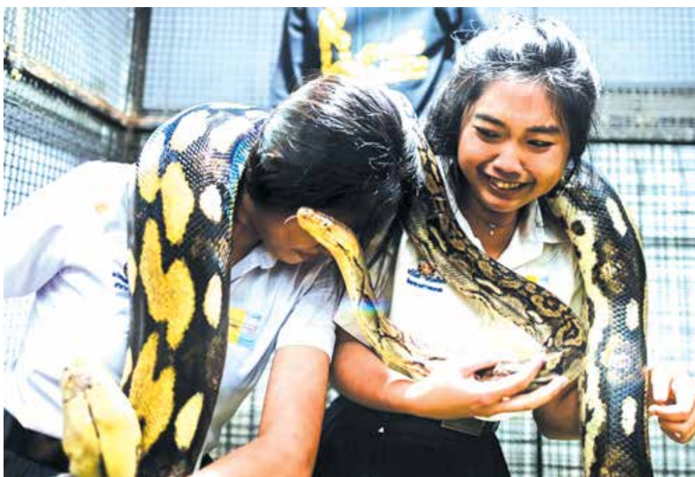
بازدیدکنندگان در حاشیه مسابقات فهرمانی حیوانات خانگی ۲۰۲۲ در شهر بانکوک تایلند با مارهای بیتون عکس می‌گیرند.