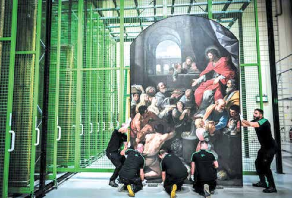
کارگران تابلویی را در محل بازسازی نقاشی‌های کلیسای نوتردام پاریس حمل می‌کنند.