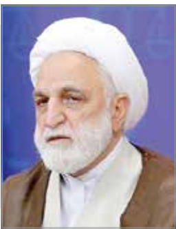
سرقت‌های زیر ۲۰ میلیون تومان هم قابل پیگیری و رسیدگی است