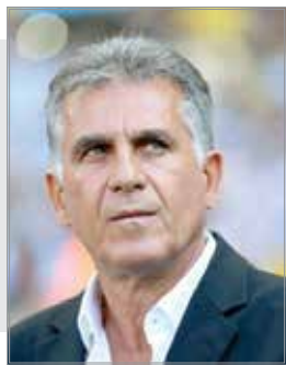
کی‌روش جایگزین اسکوپچ شد؟