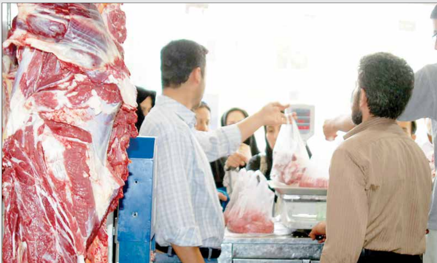
آمار عجیب از مصرف گوشت قرمز در ایران