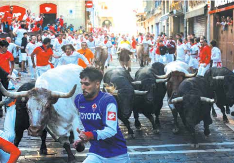
جشنواره سالانه گاوبازی سان فرمین در شهر پامپلونا در شمال اسپانیا