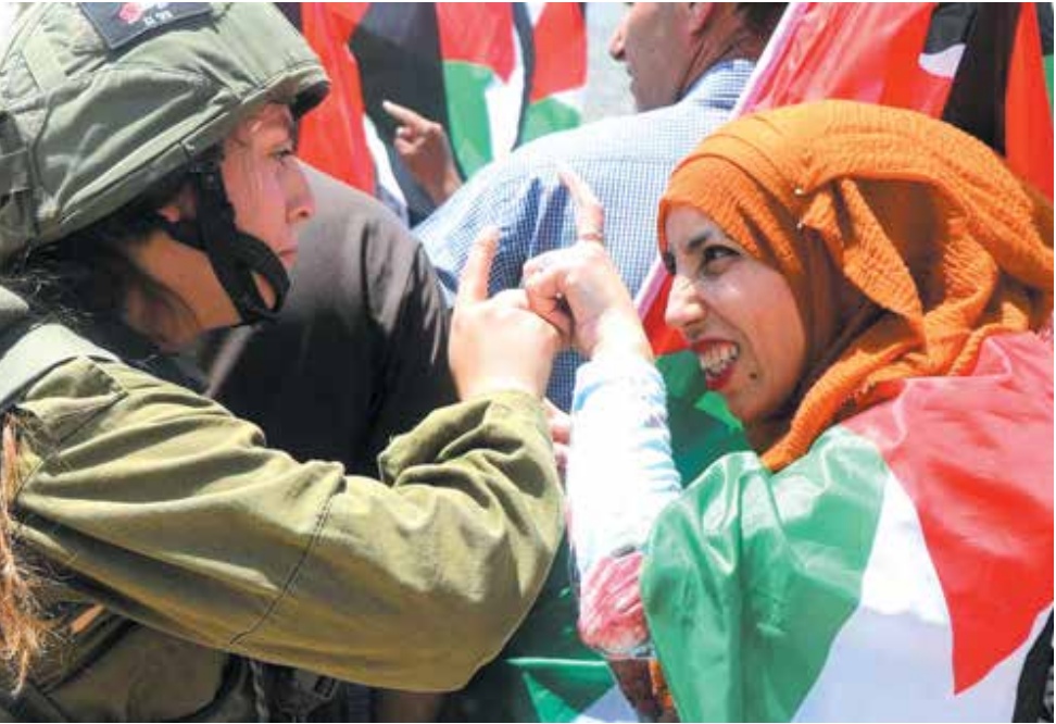
تظاهرات فلسطینی‌ها در اعتراض به شهرک‌سازی‌های غیرقانونی اسرائیل در اراضی اشغالی فلسطین در کرانه باختری