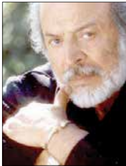
ایرج قادری کلیه هزینه مراسم و یادبود وی به مؤسسه حمایت از کودکان سرطانی اهدا گردید.

ایرج قادری در ۲۸ فروردین ۱۳۱۳ در تهران به دنیا آمد. این فیلمنامه‌نویس و بازیگر سرشناس سینمای ایران در ۴۱ فیلم کارگردان، ۴ فیلم نویسنده، ۲۲ فیلم بازیگر، ۹ فیلم تهیه‌کننده و ۱ فیلم تدوین‌گر بود. ایرج قادری دارای تحصیلات ناتمام در رشته داروسازی است. وی فعالیت سینمایی را سال ۱۳۳۳ با بازی در فیلم «چهارراه حوادث» به کارگردانی ساموئل خاچیکیان آغاز کرد. وی که اغلب به عنوان یکی از فیلمسازان سینمای پیش از انقلاب شناخته می‌شود، فعالیت خود در دوران پس از انقلاب با ساخت فیلم تاراج (۱۳۶۳) ادامه داد. بعد از این فیلم و تا اوایل دهه ۷۰ فعالیت ساخت و با درام جنایی می‌خواهم زنده بمانم فیلمنامه‌ای از رسول صدرعاملی و بر اساس داستان زندگی پدram تجریشی فعالیت خود را دوباره آغاز کرد. ایرج قادری در اردیبهشت ۱۳۹۱ به دلیل تشدید بیماری در بیمارستان مهراد بستری شد و به دلیل همین بیماری در ۱۷ اردیبهشت ماه درگذشت. طبق وصیت ایرج قادری کلیه هزینه مراسم و یادبود وی به مؤسسه حمایت از کودکان سرطانی اهدا گردید.