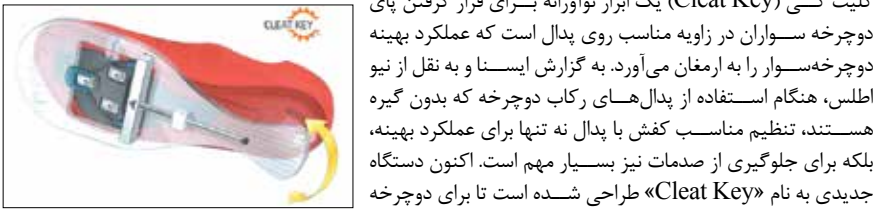
کلید CLEAT KEY در حالت بسته