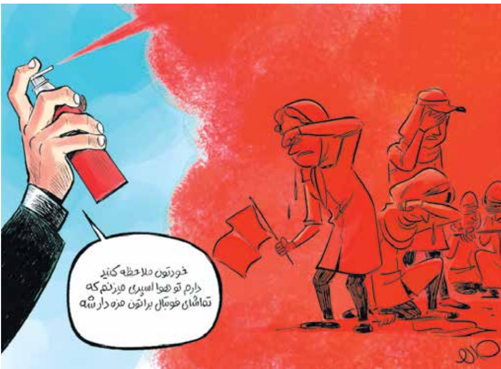
وزیر کشور هجوم مردم را دلیل بروز اتفاقات مشهد دانسته است