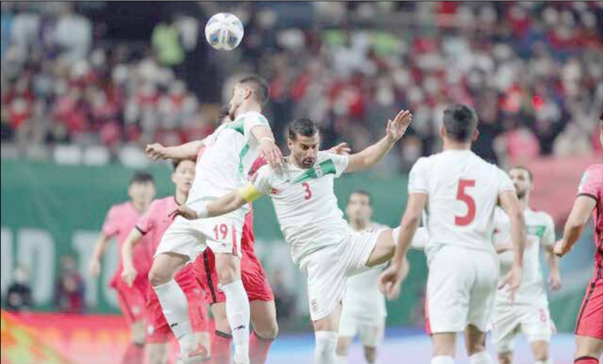
بازیکنان تیم فوتبال ایران در جریان بازی با تیم فوتبال آمریکا در ورزشگاه ملی تهران

نقطه ضعفی در کارش نداشته است. یک عده ایراد آنچنانی می‌گیرند که مسابقات جام جهانی فرق دارد و باید تفکرات مربی بهتر باشد اما نمی‌دانم چه دست‌هایی در کار است که فوتبالی نتایج خوبی را کسب کند گفت: انگلیس قدرتمندترین تیم است. آن‌ها در سال‌های دور هم با بدشانسی نتیجه نمی‌گرفتند. در ۱۹۸۶ با بدشانسی و «دست خدا» گل مارادونا که با دست زده شد) حذف شدند. در ۲۰۱۰ دور گل سالم لمپارد به آلمان را ندید. در ۲۰۰۶ هم در پنالتی‌ها حذف شدند. به طور کلی خوش شانسن نبوده‌اند اما همیشه تیم خوبی داشتند. فکر می‌کنم در این دوره هم انگلیس تا مراحل پایانی جام خواهد رفت.