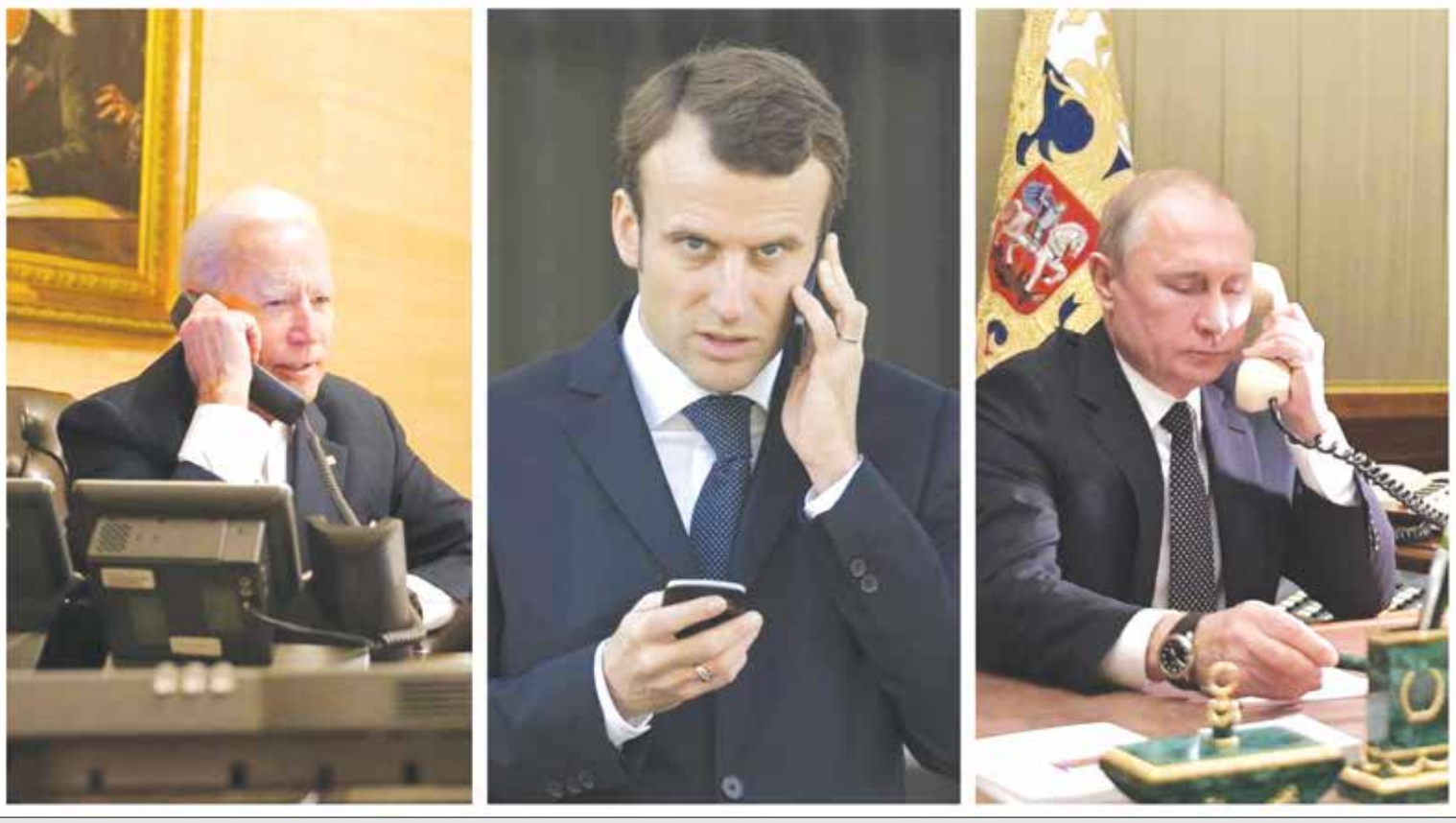
لیزه دنبال برقراری تماس کاخ سفید با کرملین است