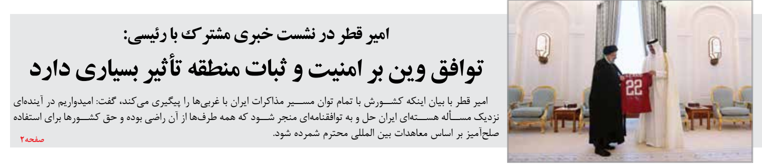
امیر قطر در نشست خبری مشترک با رئیسی: توافق وین بر امنیت و ثبات منطقه تأثیر بسیاری دارد