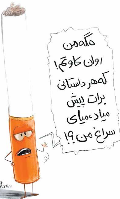
تصویرات غلط برای مصرف دخانیات