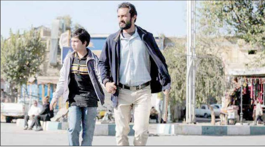
فیلم «قهرمان» به کارگردانی اصغر فرهادی در دو شاخه دریافت جایزه شد. به گزارش ایرنا از پایگاه اطلاع‌رسانی از ششمین دوره از جوایز منتقدان مستقل شیکاگو نامزد ریل‌شیکاگو( reelchicago)، منتقدان مستقل شیکاگو افزود.