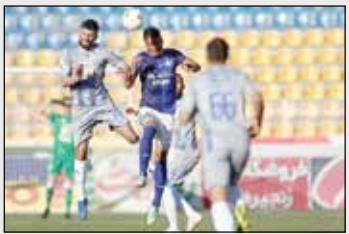
باشگاه استقلال در صورتی که با رای کمیته انضباطی فدراسیون فوتبال مقابل گل گهر سرجان سه بر صفر برنده نشود به فدراسیون بین‌المللی فوتبال (فیفا) و دادگاه عالی ورزش (CAC) شکایت خواهند کرد. به

گزارش ایرنا، بلافاصله پس از پایان بازی با گل گهر در سرجان، مقامات باشگاه استقلال نسبت به مدارک و سوابق بازیکن اهل گلین میزبان تشکیک کرده و اعتراض رسمی خود را در اختیار فدراسیون فوتبال گذاشتند تا پرونده به صورت جدی بررسی شود. دیدار تیم‌های استقلال و گل گهر سرجان سوم آذر در چارچوب هفته ششم لیگ برتر فوتبال باشگاه‌های کشور برگزار شد که ۲ تیم به تساوی بدون گل رضایت دادند. اخبار جدی از راهروهای فدراسیون فوتبال شنیده می‌شود مبنی بر اینکه نتیجه بازی استقلال و گل گهر تغییری نخواهد کرد و این اتفاقی نیست که باشگاه استقلال به سادگی از کنار عبور کند. باشگاه استقلال در صورتی که رای کمیته انضباطی فدراسیون فوتبال به صورت رسمی اعلام شود سراغ مجاری دیگری برای احقاق حق مورد ادعای خود می‌رود. آنها قصد دارند به فدراسیون بین‌المللی فوتبال (فیفا) و دادگاه عالی ورزش (CAC) شکایت کرده و تا آخر پیگیری شکایت خود باشند.