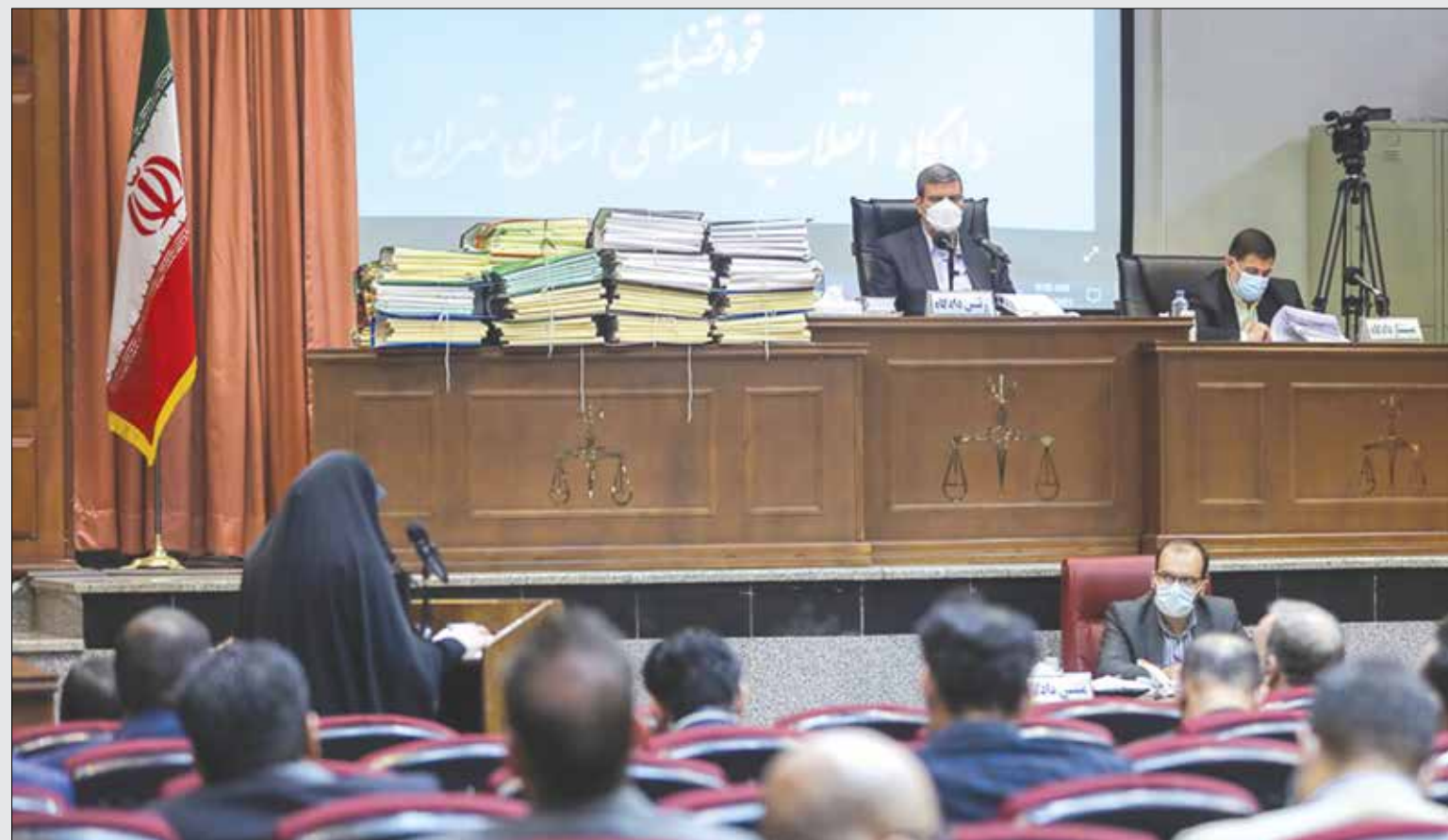
دادگاه متهمان پرونده ثبت سفارش خودرو برگزار شد