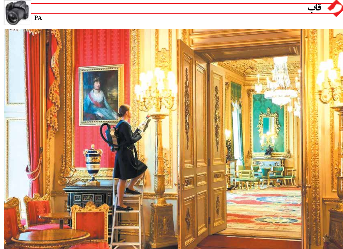
نقافت قلعه وینسور یکی از اقامتگاه‌های ملکه بریتانیا