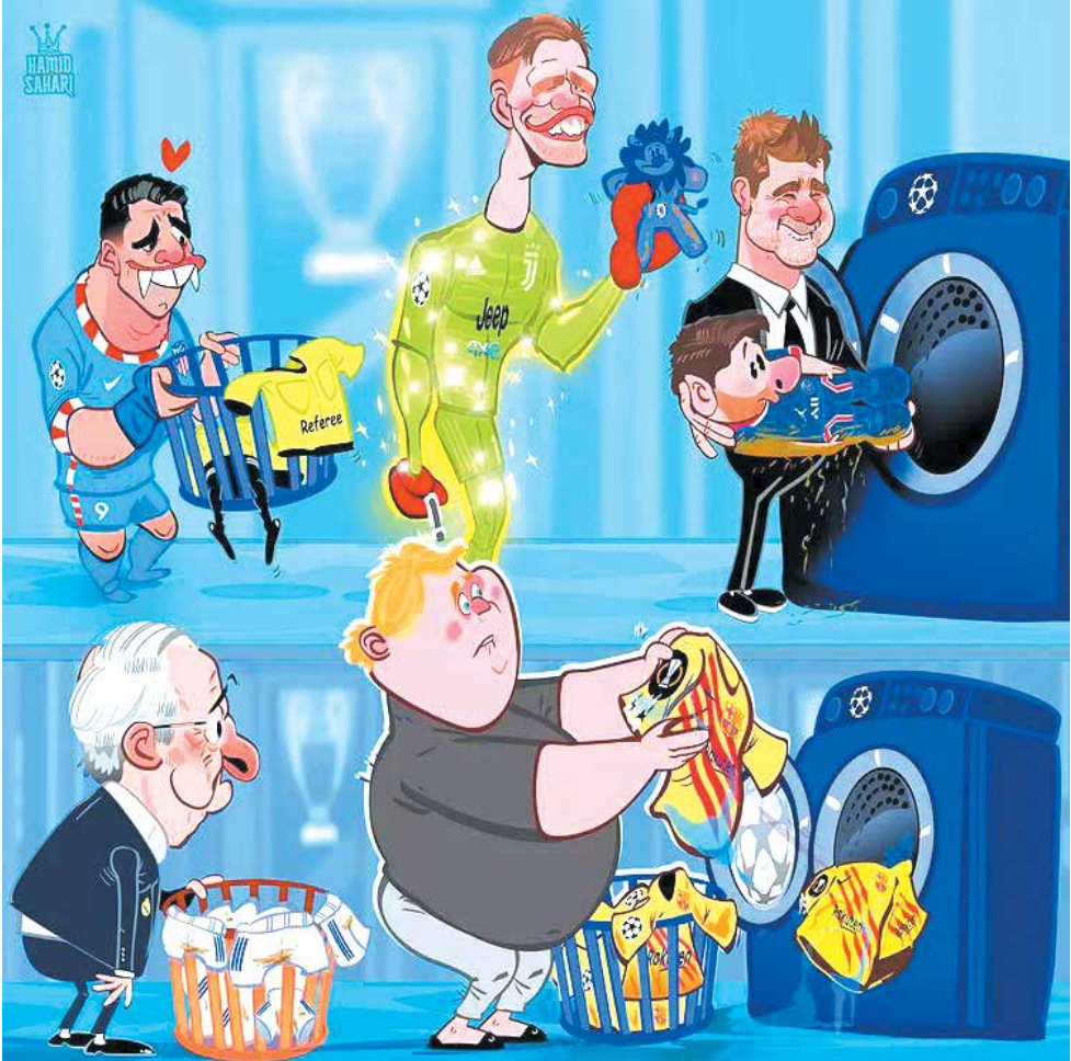
اتفاقات و حواشی هفته دوم لیگ قهرمانان باشگاه‌های اروپا