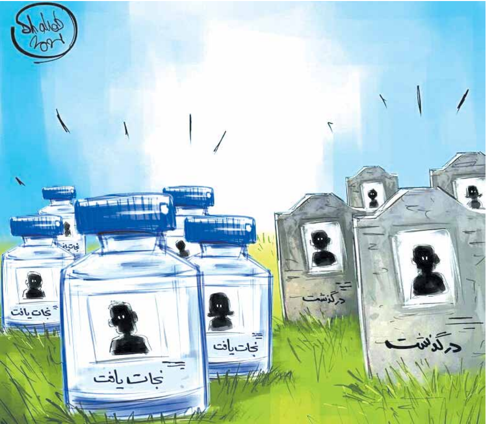
فرق واکسن زده‌ها و نزه‌ها